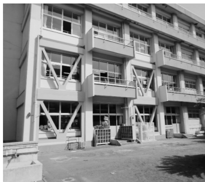
耐震対策がすすむ小中学校校舎