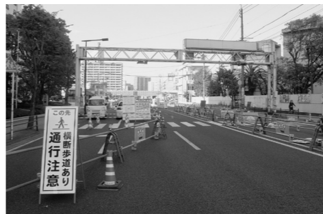
急ピッチですすむ大道陸橋撤去工事