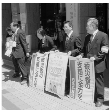
東日本大震災救援募金に取り組む市議団

釘宮市政2期目、市民犠牲の民間委託などの「行政改革」の推進、学校選択制の導入や小中一貫校の実施など競争教育を持ち込むなどの姿