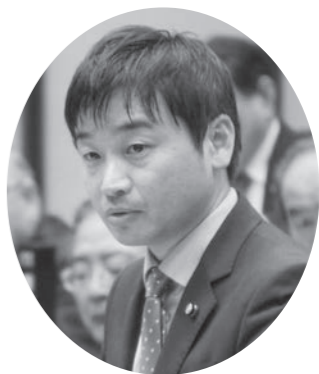
岩崎 貴博 議員